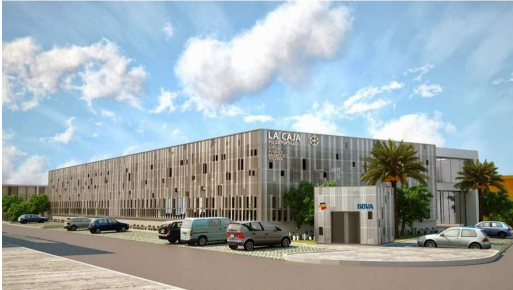
CENTRO DEPORTIVO "LA CAJA" Santa Marta Sede Principal XVIII JUEGOS BOLIVARIANOS